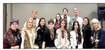
Фолкльорно Театральна Група 128-го відділу СУА

Програма з участю мистецьких гуртів Філядельфійської громади.