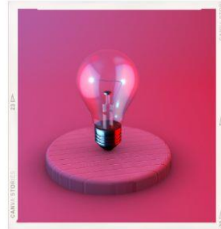
Your Ideas Ваші пропозиції