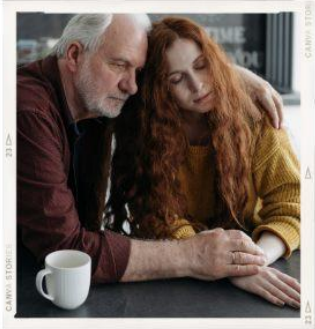
Grieving Support Group Група підтримки