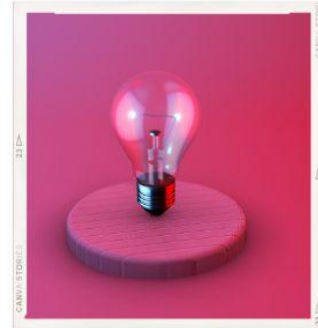
Your Ideas Ваші пропозиції