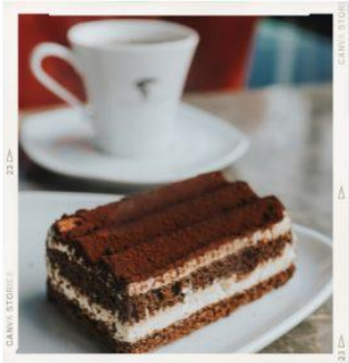
Sell Coffee & Sweets Продаж кави та солодкого