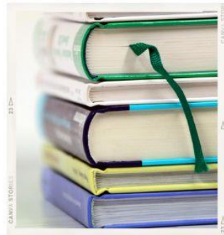
English Teacher for Adults Вчитель англійської мови для старших