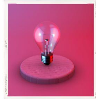
Your Ideas Ваші пропозиції