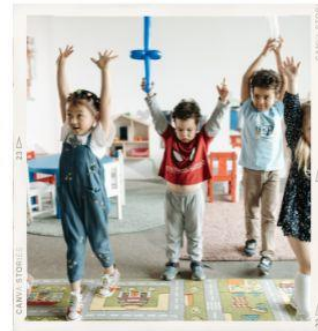
Youth Ministry Молодіжне служіння