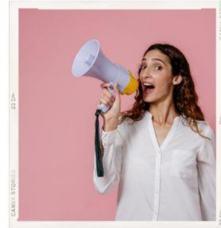
Evangelization Outreach Євангелізаційна група