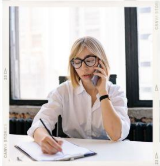
Parish Secretary Секретар – архівіст