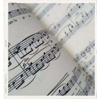
Choir Members Членів хору