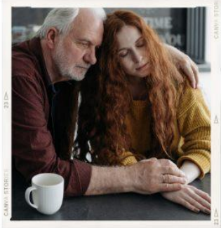
Grieving Support Group Група підтримки