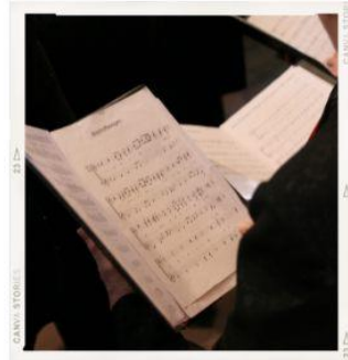
Saturday Evening Liturgy Cantor